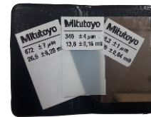
Conjunto de 3 filmes de calibração